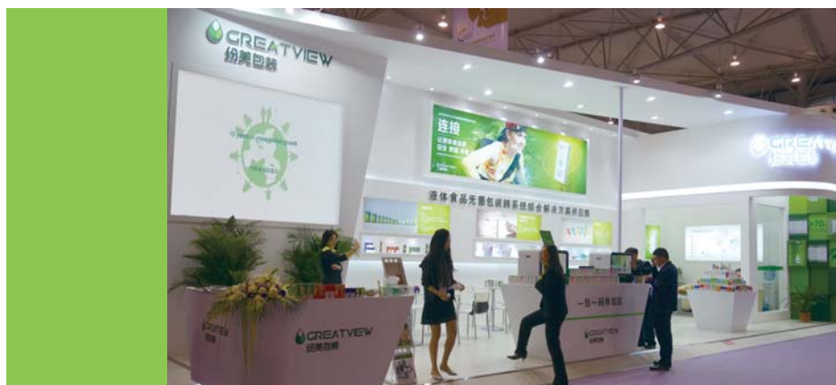
全球首創無菌包裝一包一碼技術亮相成都春季糖酒會

於我們的國際業務連續數年取得強勁增長後，我們已於二零一六年上半年末決定在位於德國哈雷的歐洲工廠新增第二條年產能40億個包裝的生產線及擴建倉庫。該等新生產設施的估計總投資額約23百萬歐元，預期於二零一七年年中投產。新增設備及廠房擴建將增加我們業務運營的產能、靈活性及效益，從而有助於對客戶的交付服務、響應能力及交付最優產品。我們相信該投資不僅是將年產能提高一倍，它顯示了我們對市場份額持續增長的信心。